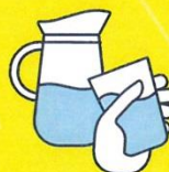
BUVEZ DE L'EAU