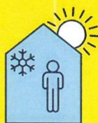
RESTEZ AU FRAIS